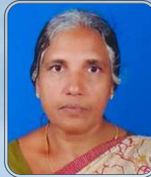
എലുവത്തികൽ കുനൻ മറിയം ജോണി