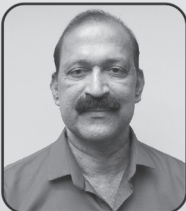
പോൾസൻ പി. ആർ. കൺവീനർ, പബ്ലിസിറ്റി