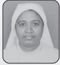
റവ. സി.കാതറിൻ SMC കൺവീനർ - ലിറ്റർജി